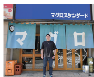
「マグロスタンダード 錦糸町本店」 墨田区江東橋2-15-6 1F 050-5447-8019 (月~金)16:00~24:00(L.O.23:00) (土)13:00~24:00(L.O.23:00) (日)13:00~23:00(L.O.22:00) / 夜ハル 17:00~ 定休日:なし