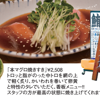
「本マグロ焼きすき」¥2,508 トロツと脂のつた中トロを網の上で軽く炙り、かいわれを巻いて卵黄と特性のたしていただく、看板メニュー!! スタッフの方が最高の状態に焼き上げてくれます。

の間、お父様がマグロ専門の卸業者になったことで、より自分のお店のコンセプトが絞り込まれて「マグロスタンダード」が誕生しました。名前の由来