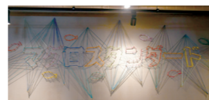
店内奥の壁にある店名オブジェは、漁業に使われる網やロープをモチーフにしています。

の間、お父様がマグロ専門の卸業者になったことで、より自分のお店のコンセプトが絞り込まれて「マグロスタンダード」が誕生しました。名前の由来