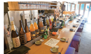
大きな「マグロ」の暖簾と海をイメージした青い看板が目印! 店内の内装にも「青」がポイントで使われています。